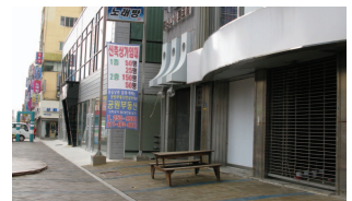
가로정비사업 후 건축물 신축에 대한 관리방안이 마련되어 있지 않아 가로공간의 연속성을 확보하지 못함