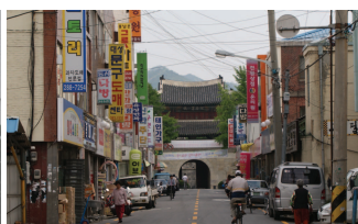
도청이전으로 주변지역 상가쇠퇴