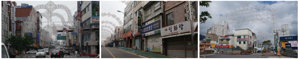
많은 지자체에서 관광객 유치를 위해 루미나리어를 설치하고 있지만 집객 효과는 지속적이지 못하고 오히려 유지관리 비용 발생에 따른 부작용이 따르고 있음