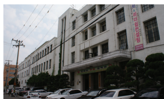
빈공간으로 남아 있는 구 전북도청