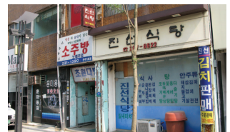
간판정비사업으로 간판이 정비된 이후에 상인들이 기존방식대로 간판을 재설치하고 있음