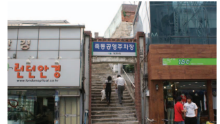
공영주차장 조성시 주변 공공공간과의 연계를 고려하지 않아 접근성이 떨어지고 장애인과 노약자의 사용을 배제함