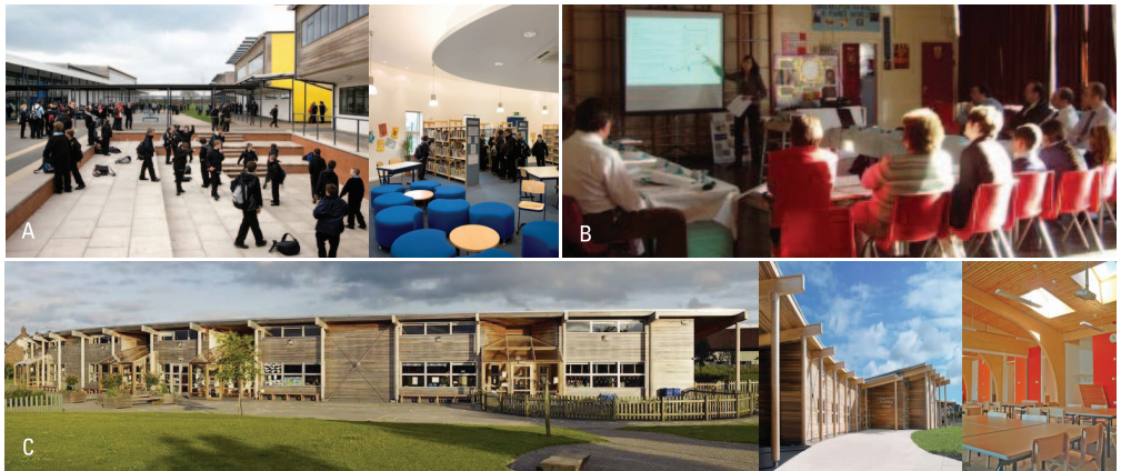
C. BSF 프로그램에서 제시하는 지속가능한 학교시설 디자인 사례 (Kingsmead Primary School, Cheshire)