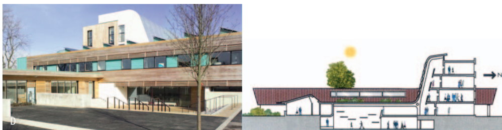
D. 에너지 절감, 탄소저감 등 학교시설의 지속가능한 형태 (The Academy of St. Francis of Assisi, Liverpool)