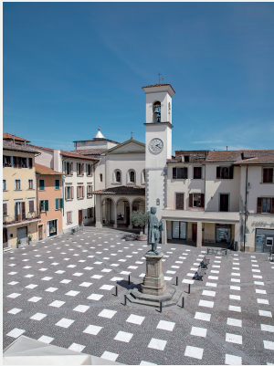
안전거리를 시각화한 Giotto 광장의 바닥패턴

https://www.caretstudio.eu/caret_studio/