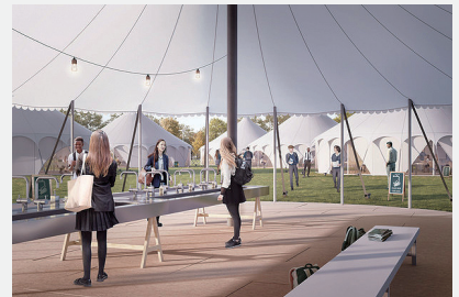
사회적 거리두기를 적용한 텐트형 교실