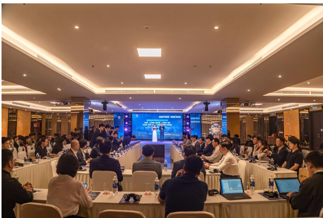
The 2 nd HUE International Forum 행사장 전경