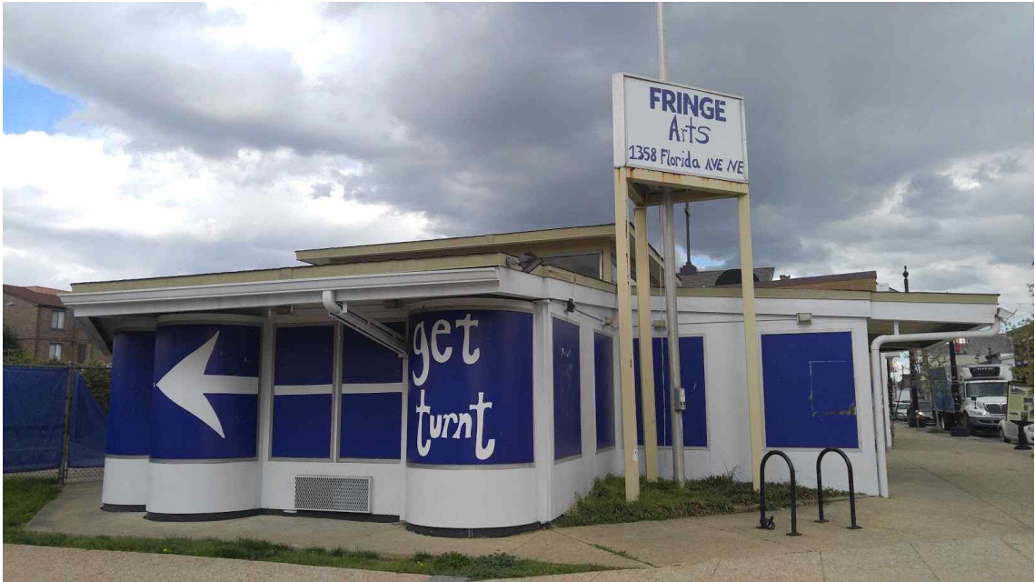
[아트플레이스 대상지 사진]