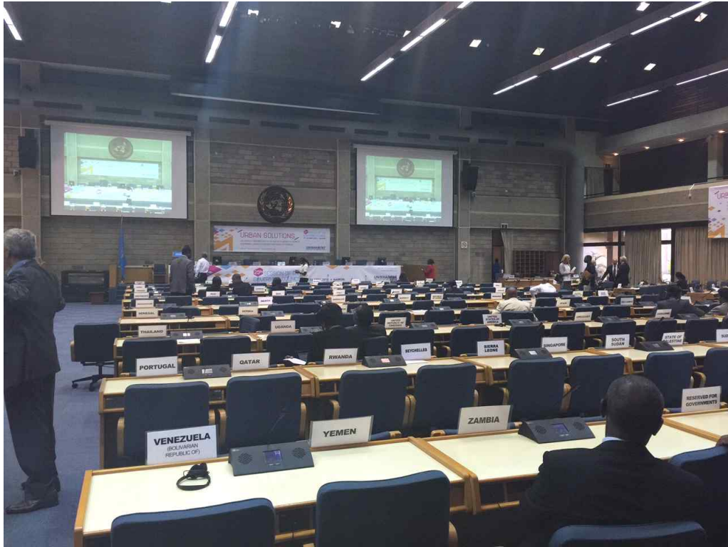
그림 3 유엔헤비타트 제25차 집행이사회 전체회의 전경