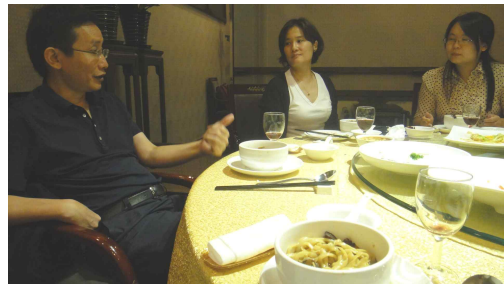
중국사회과학원 관계자 면담 후 기념촬영 및 식사전경