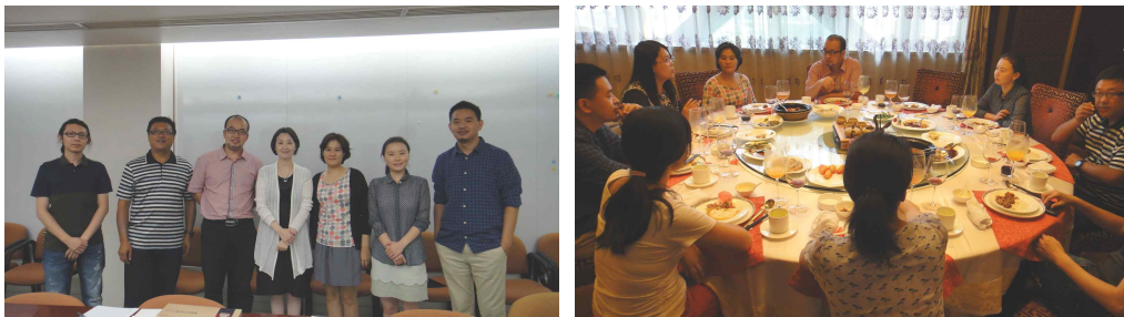
CAUPD 관계자 면담 후 기념촬영 및 식사전경