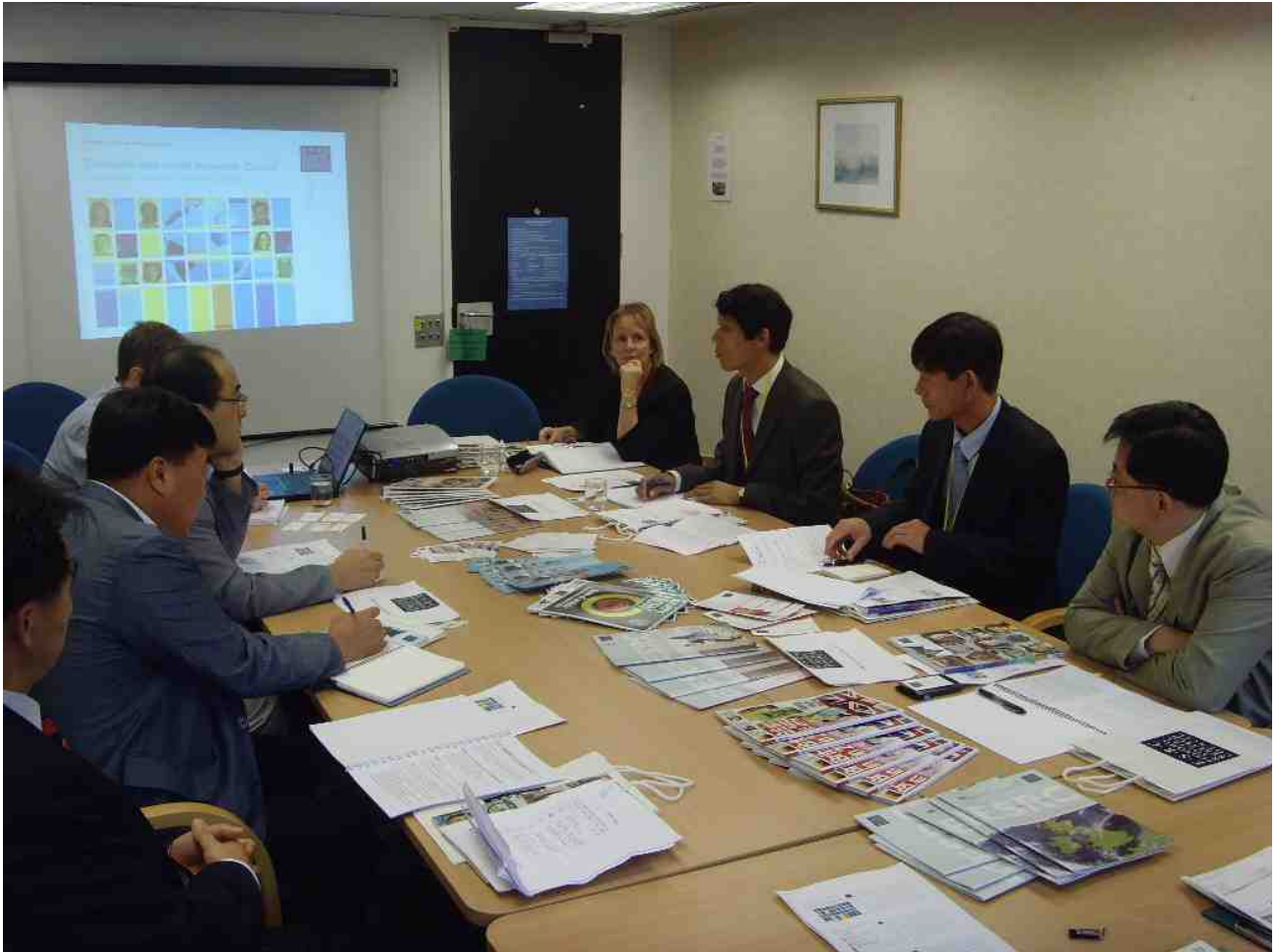
<사진 : ESRC 회의실>