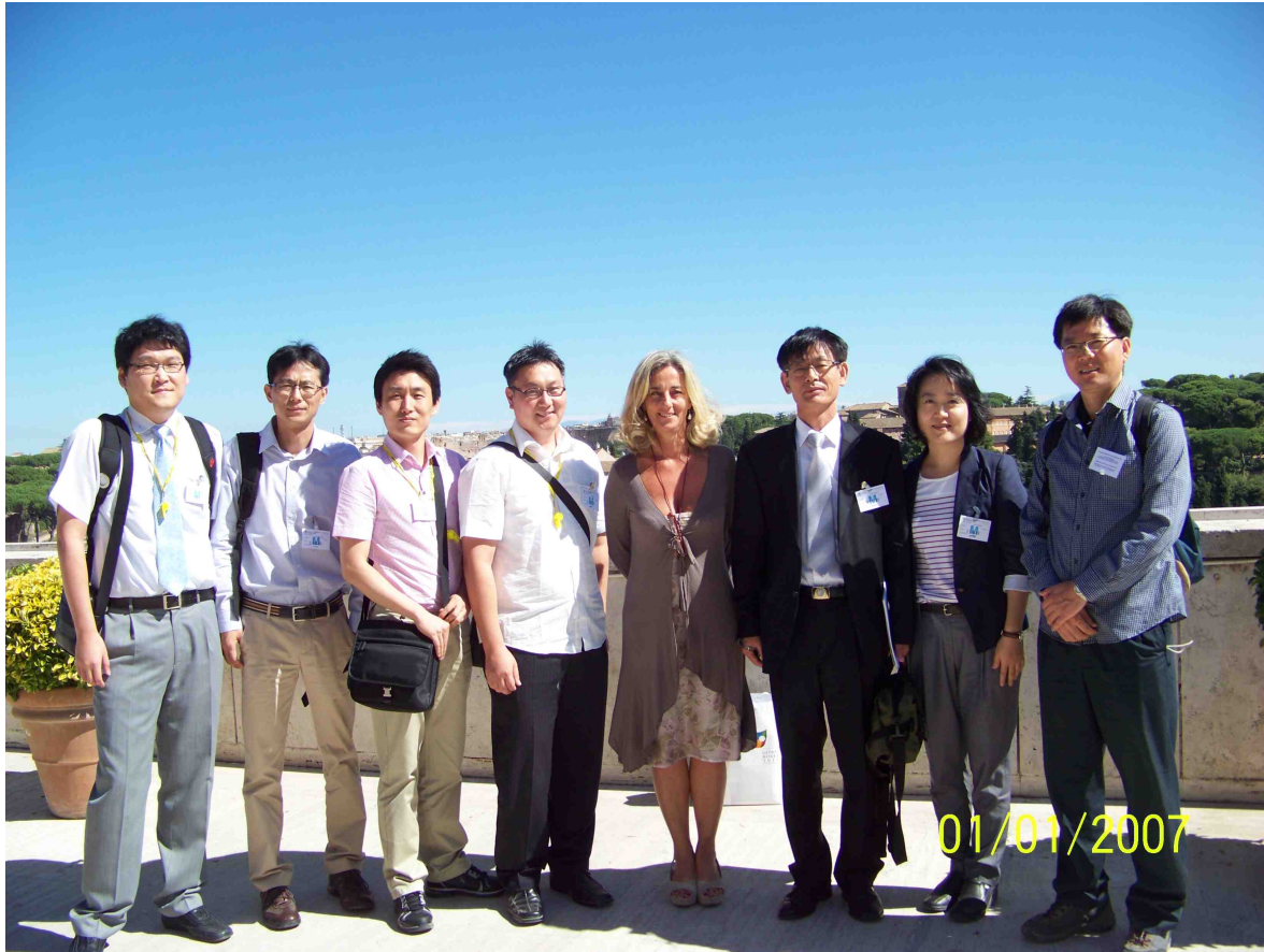
<사진 : FAO 본부>