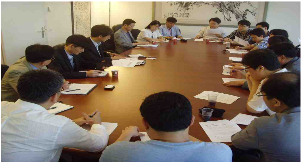
<사진 : 주 제네바대표부 회의실>