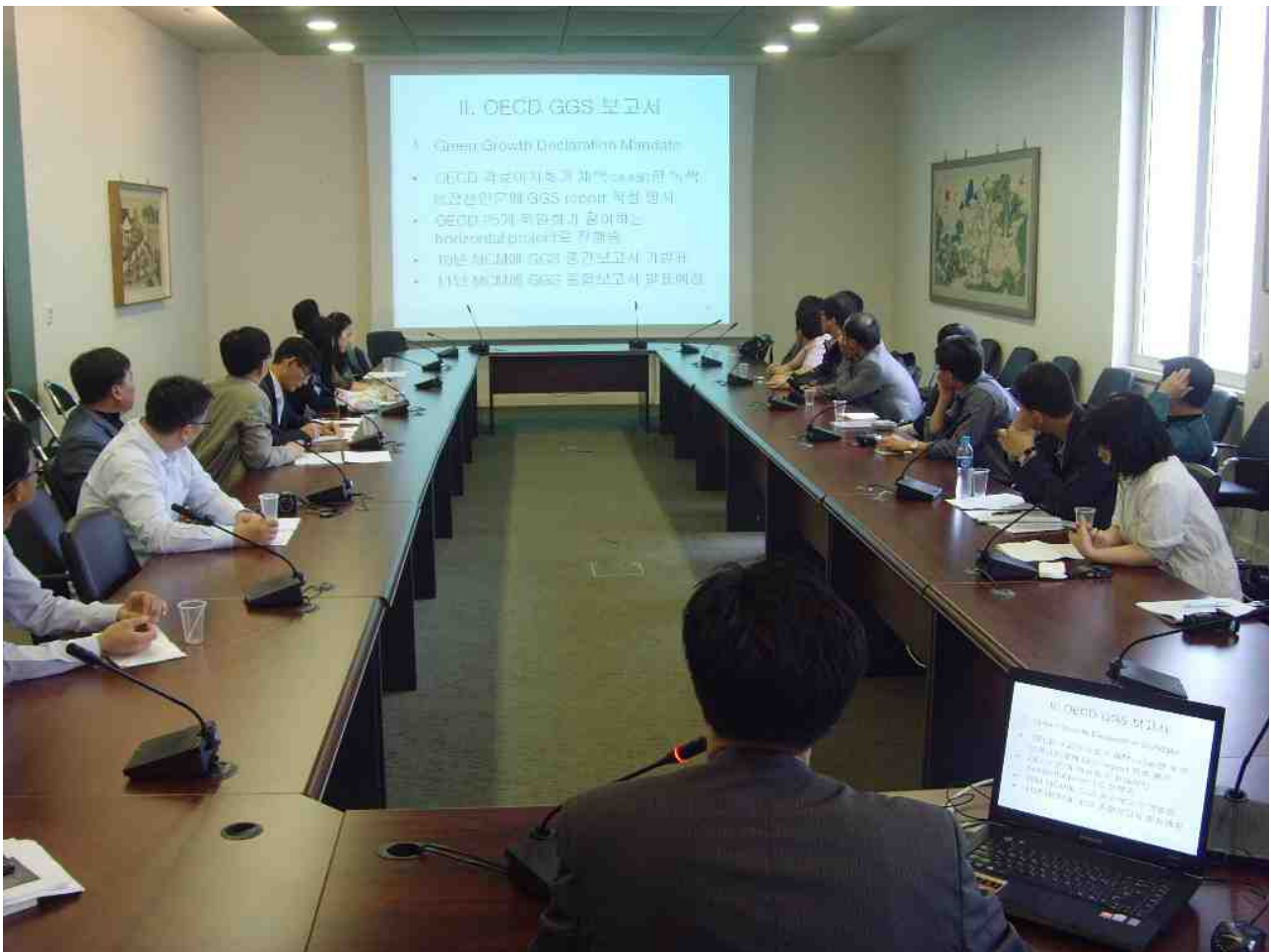
<사진 : 주 OECD 대표부 회의실>