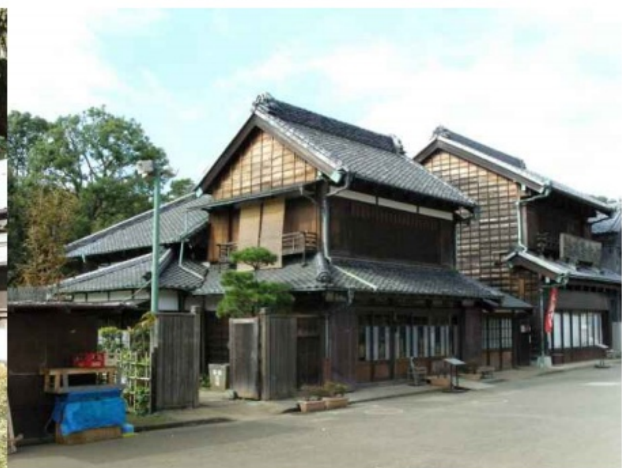
야외전시장(근대초 상업건물 및 가로 이축)