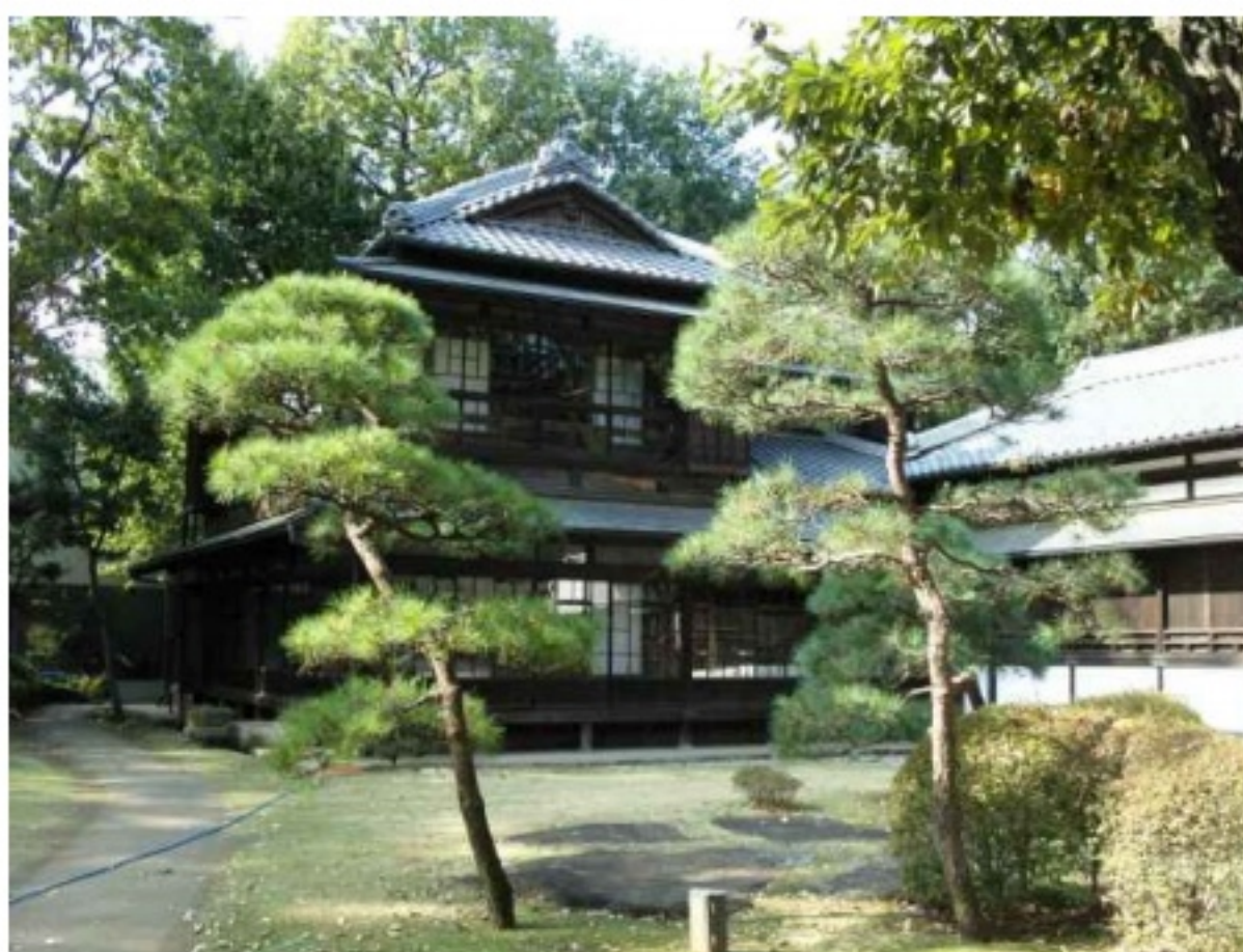
야외전시장(근대초 유명정치인의 저택 이축)