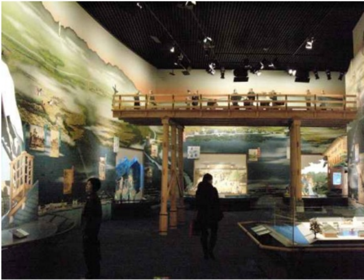
실내전시(실물일부재현 및 벽면활용)

○ 사물 : 다양한 체험자료 (전통놀이 체험, 고대의상 체험, 근대은행업무 체험, 활동지 활용)