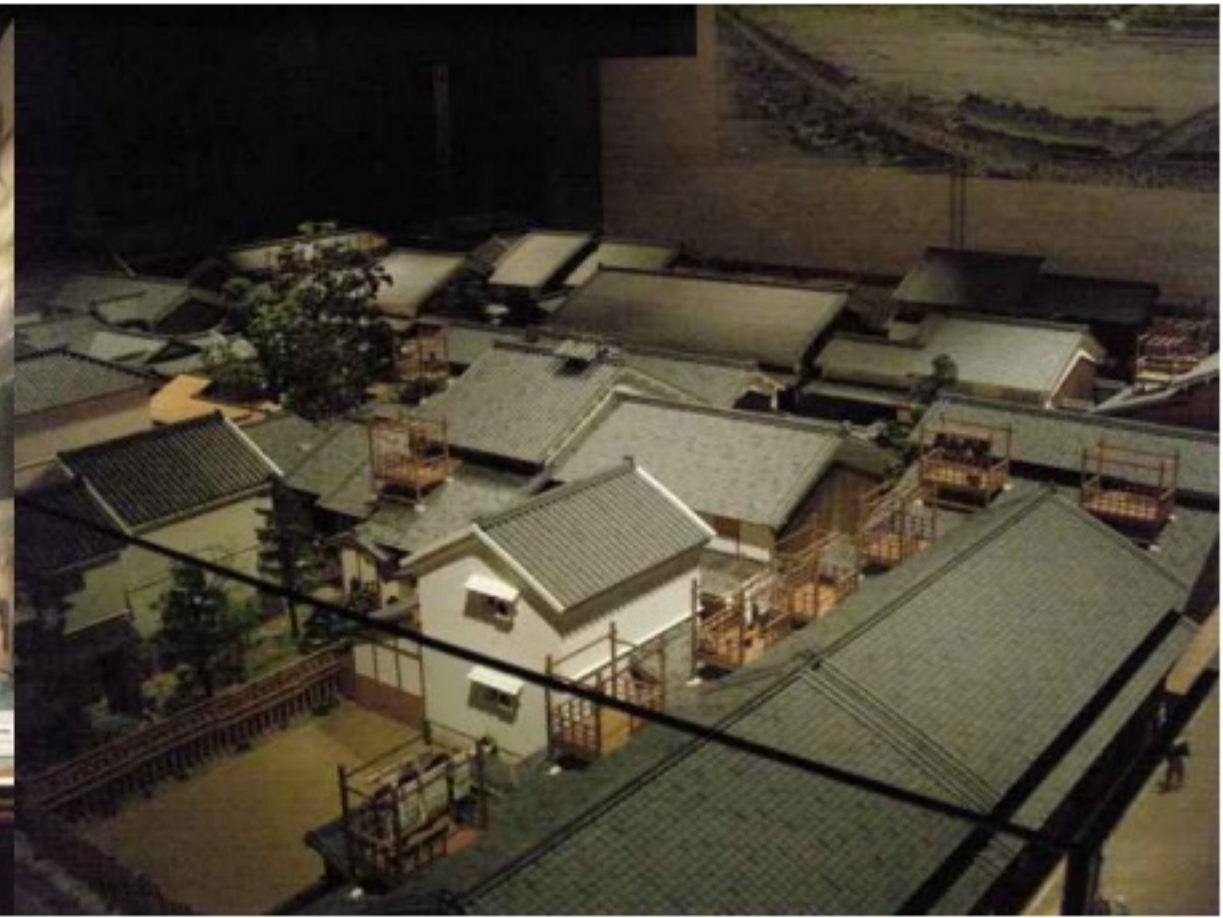
실내전시(건축물 및 도시공간 모형)