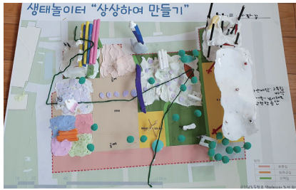
놀이터 모형 만들기