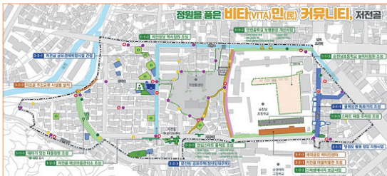
도시재생 뉴딜사업 저전동(일반근린형) 사업구상도

순천남초등학교 내부에서도 질적인 교육 환경 개선 및 학교 공간의 다양성 등에 대한 고민이 많아지던 시기와 맞물려 2017년 12월 저전동 일대가 ‘국토교통부 도시재생 뉴딜사업(일반근린형)’에 선정되었다. 학교 부지 전체가 뉴딜사업 대상지에 포함된 것은 저