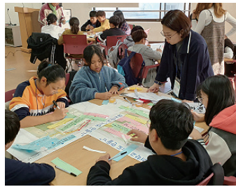
놀이터 디자인 워크숍