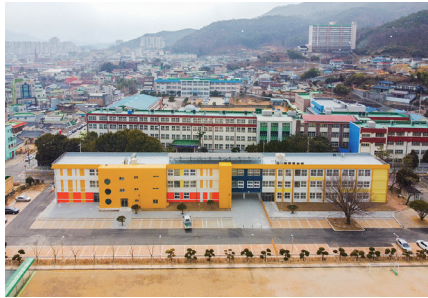
現 비타민센터 모습